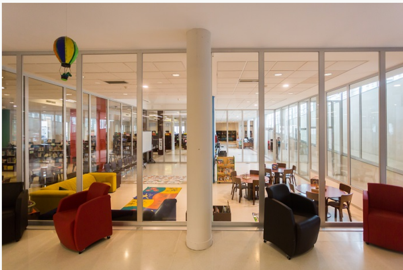
Vista exterior de la Sala infantil y juvenil

Situada en la planta baja de la Biblioteca, a la izquierda del mostrador principal, esta zona está especialmente pensada para acoger al público infantil y juvenil (hasta 14 años).