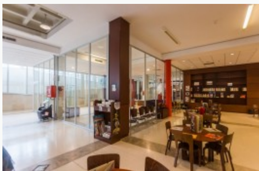
Vista de la Ludoteca