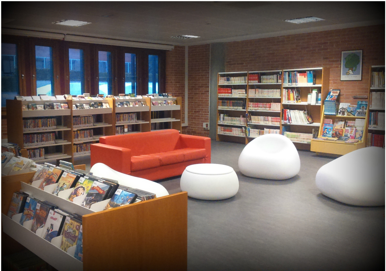
Infantil y juvenil

La zona Infantil y Juvenil se encuentra en el primero andar de la Biblioteca. ES para uso exclusivo de las niñas y niños menor de 14 años y los/las sus acompañantes.